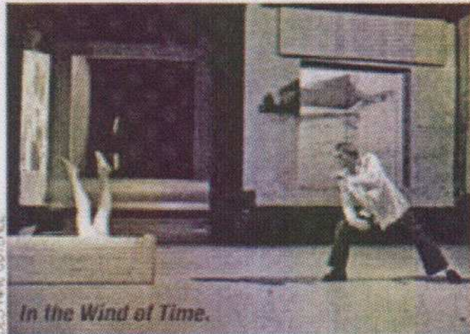
In the Wind of Time.